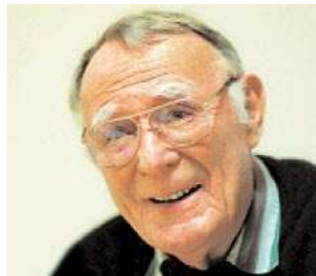
Основатель IKEA Ингвар Камрад

Предлагаемая продукция имела четкие дифференцирующие черты. Все было простым, качественно сделанным, по-скандинавски элегантным. Все продавалось в разобранном виде для самостоятельной сборки покупателями, что снижало цену и срок доставки из магазина (чем отличаются другие мебельные фирмы). Огромные пригородные магазины имели огромные парковки, рестораны, детские игровые комнаты, инвалидные кресла и т.п. Покупатели ожидали стиля и качества по разумным ценам. IKEA реализовала эти ожидания, предоставляя покупателям возможности самостоятельного создания ценности путем исполнения функций, традиционно отдаваемых производителю или продавцу: например, доставка и сборка. Разумеется, это также снижало издержки. Также на это работало и то, что покупателям в торговом зале выдавались бумажные «метры», карандаши и блокноты для записей – требовалось меньше продавцов.